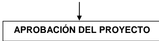
GRAFICO QUE EXPLICA EL DESARROLLO DEL INFORME DE TESIS